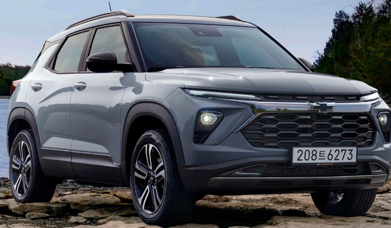
더 뉴 트레일블레이저 ACTIV 스틸링 그레이