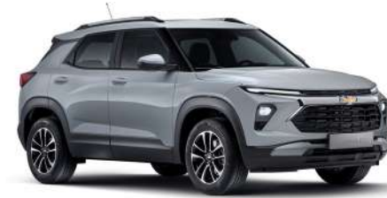
스털링 그레이 (GZB)