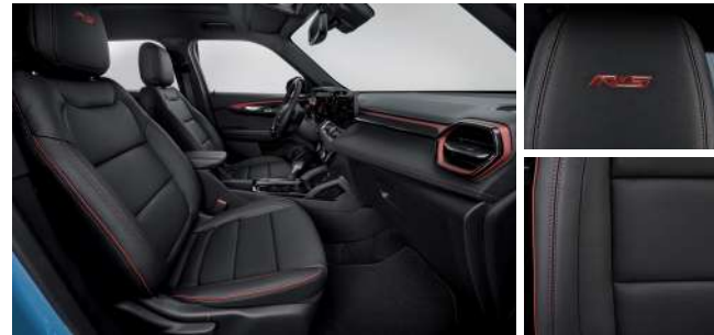
젯 블랙 & 레드 포인트 인테리어 (RS)

* 상기 이미지는 콤포트 패키지 선택 시 천공 천연 가죽시트가 적용된 이미지임 (Premier)