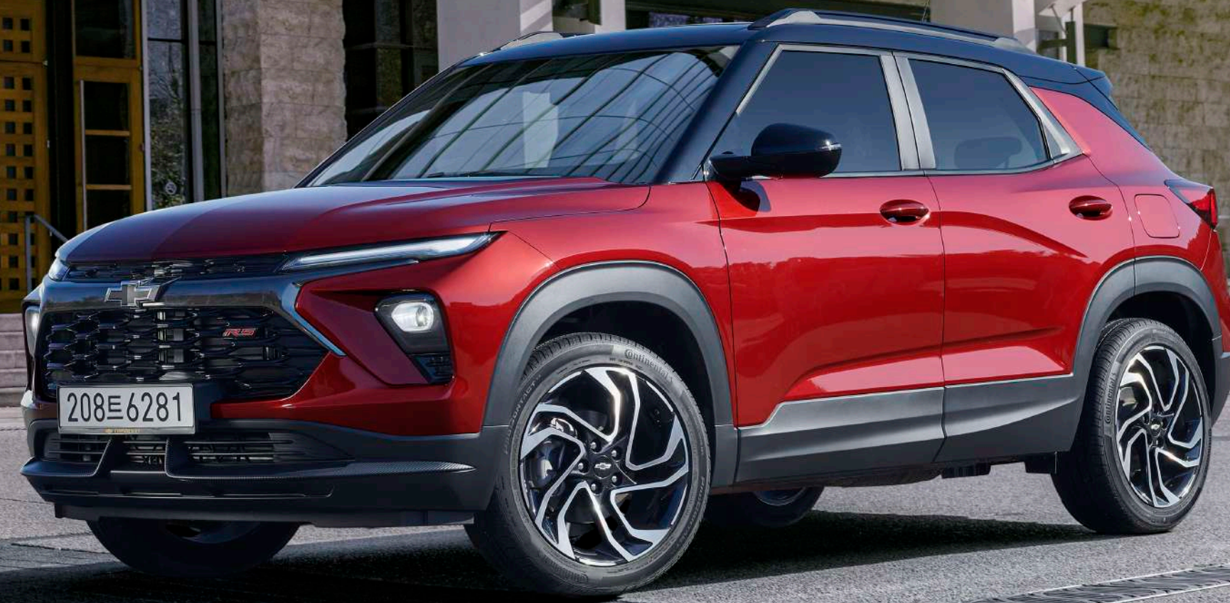
더 뉴 트레일블레이저 RS 밀라노 레드