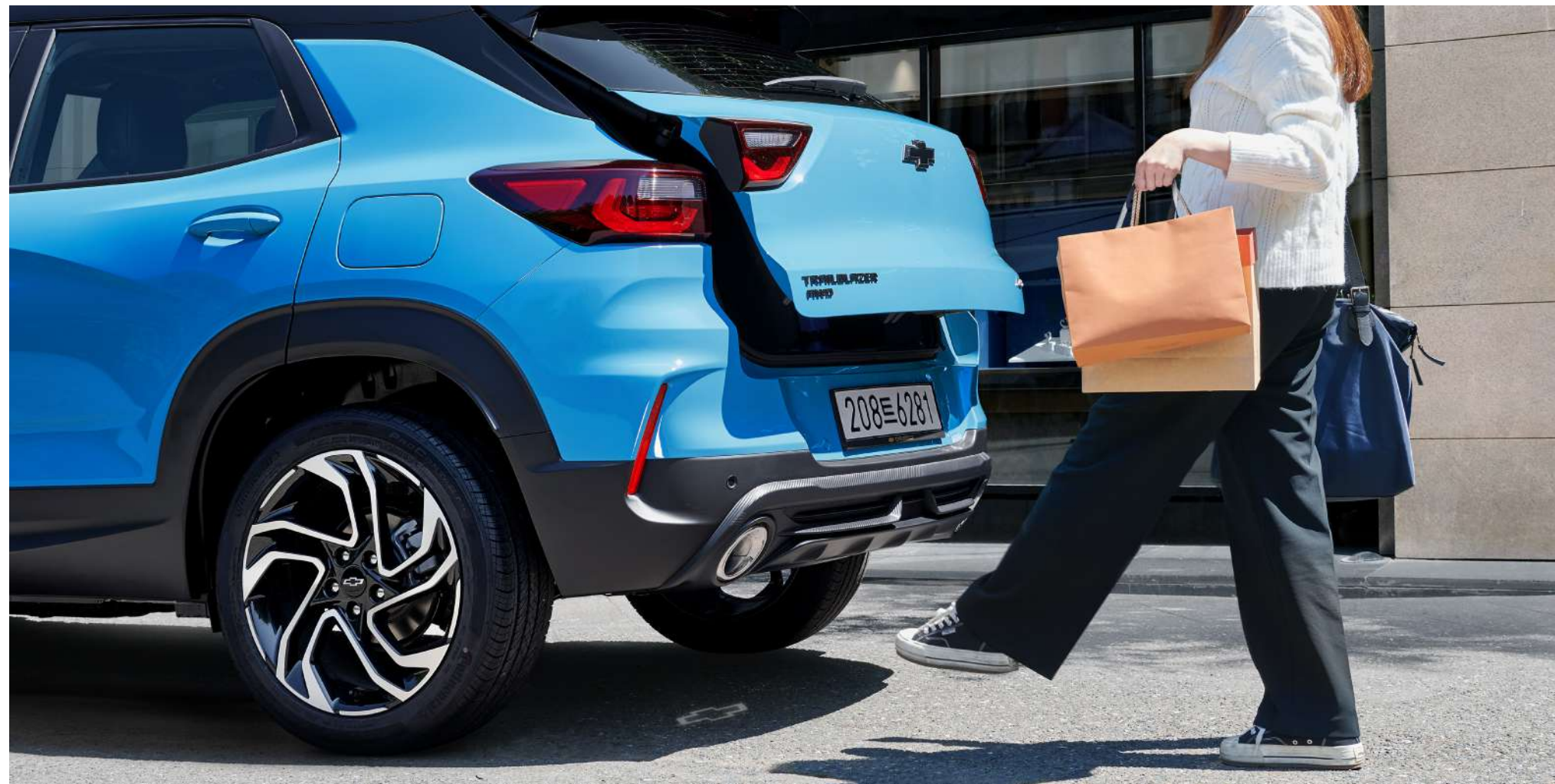
보타이 프로젝션 핸즈프리 파워 리프트게이트