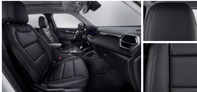
젯 블랙 & 빅토리아 헤링본 포인트 인테리어 (Premier)