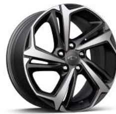
18인치 RS 머신드 알로이 휠 (RS 전용)