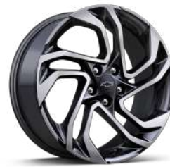
19인치 RS 카본 플래시 머신드 알로이 휠 (RS 전용)