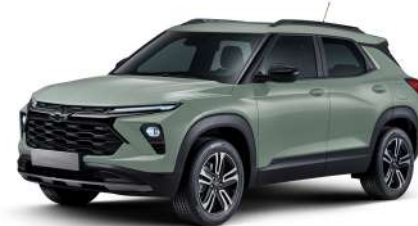
피스타치오 카키 (GVR)