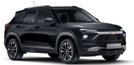
모던 블랙 (GB0)