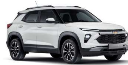
퓨어 화이트 (GAZ)