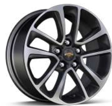
17인치 머신드 알로이 휠 (Premier 전용)