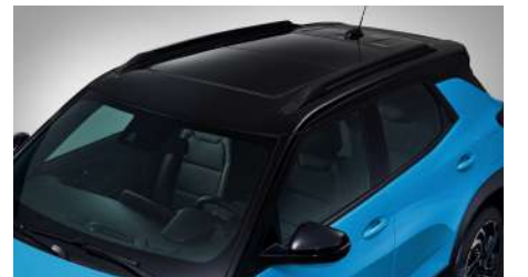
RS ROOF (모던 블랙)