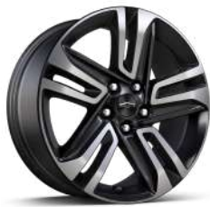
18인치 ACTIV 머신드 알로이 휠 (ACTIV 전용)