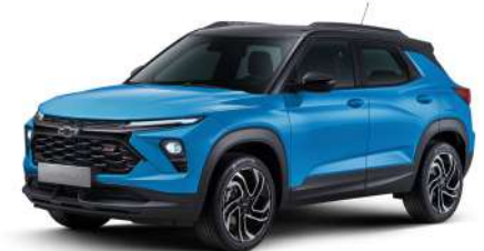
NEW 마리나 블루 (GKN)