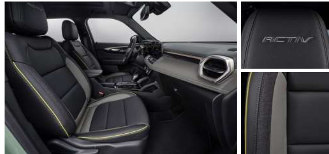
젯 블랙 & 아르테미스 포인트 인테리어 (ACTIV)