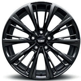
19" ALUMINUM ALLOY WHEELS WITH SATIN GRAPHITE DARK FINISH