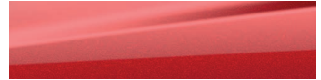
RADIANT RED TINTCOAT