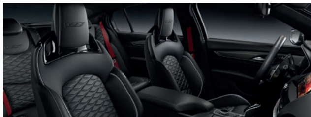
Leather Seating Surfaces with sueded back panel